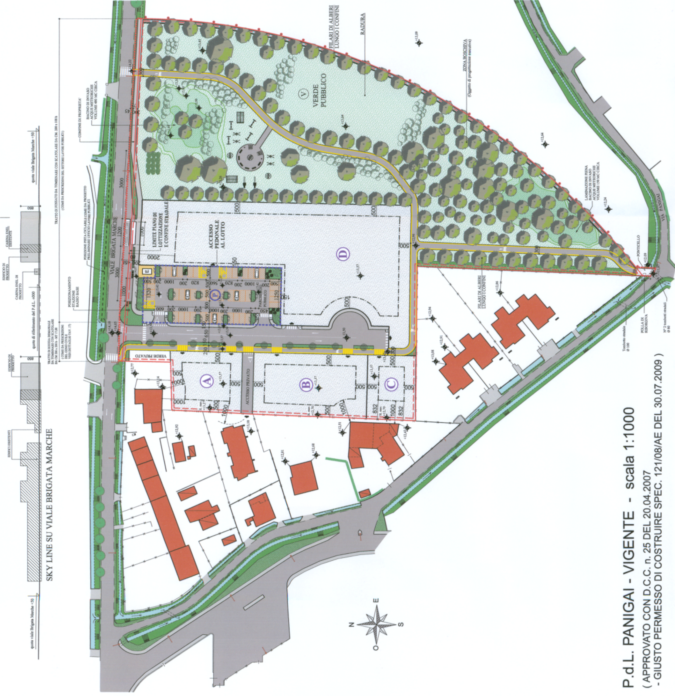
P.d.L. PANIGAI - VIGENTE - scala 1:1000 ( APPROVATO CON D.C.C. n. 25 DEL 20.04.2007 - GIUSTO PERMESSO DI COSTRUIRE SPEC. 12/108/AE DEL 30.07.2009 )