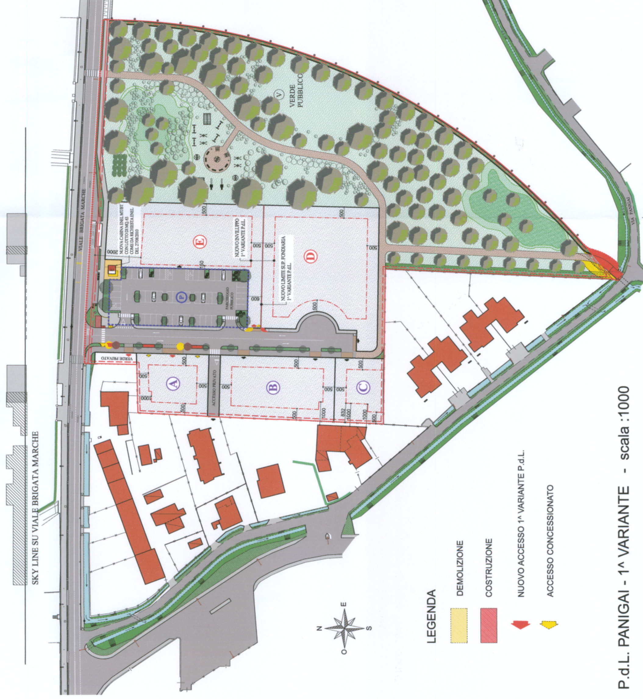
P.d.L. PANIGAI - 1 a VARIANTE - scala :1000